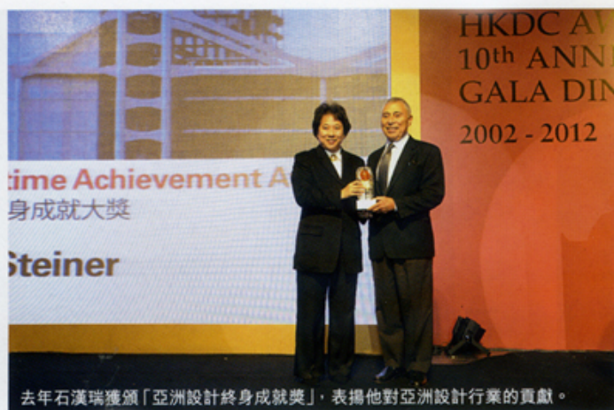
去年石漢瑞獲頒「亞洲設計終身成就獎」，表揚他對亞洲設計行業的貢獻。