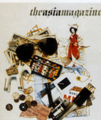
當初正因 Asia Magazine 的創立，把石漢瑞從歐洲帶到香港。

歷史、社會環境甚至語言均有別於歐美，對平面設計的概念亦有很大分別，若當年沒有朋友的支持，我想我未必能達到今天的成績。」