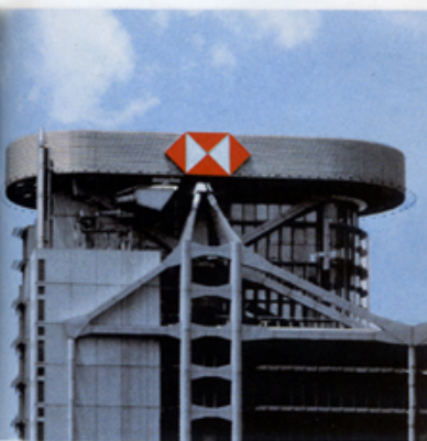
匯豐標誌中間紅色三角象徵財富累積的沙漏，兩旁則如一雙翼，比喻業務擴展。