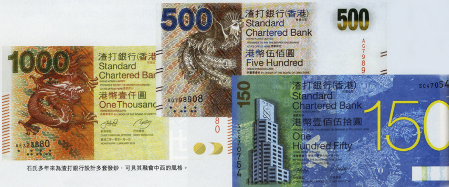
石氏多年來為渣打銀行設計多套發鈔，可見其融會中西的風格。

“對我而言，設計不僅是創意思維與智力的鍛煉，更需時刻保持開放態度，以迎接任何新的意念。”