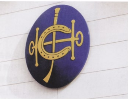
香港賽馬會：1996年決定刪除皇家（Royal）一詞，由於原用的花押字圖案深入民心，最後，HJC縮寫、馬蹄鐵和韁繩都以黃色和藍色加以修飾，並放入一個橢圓形中。